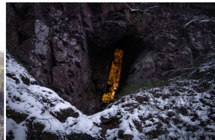
Denna bild togs en juldag. Bergakungen håller gästgäbuden för skogens väsen!

– I höstas hade jag en utställning på ett äldreboende. Där fanns det bland annat en dam som berättade att hon dagligen tittade på